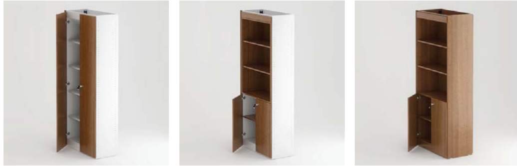
Arm. c/ portas e estrutura standard Cabinet with doors and standard structure