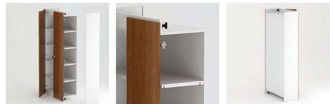
Armário de costa encastrada e estrutura standard Built-in back cabinet and standard structure