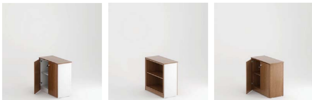
Arm. c/ portas e estrutura standard Cabinet with doors and standard structure