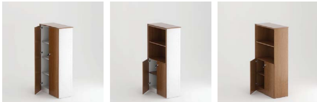
Arm. c/ portas inf. e estrutura standard Cabinet with inferior doors and standard structure