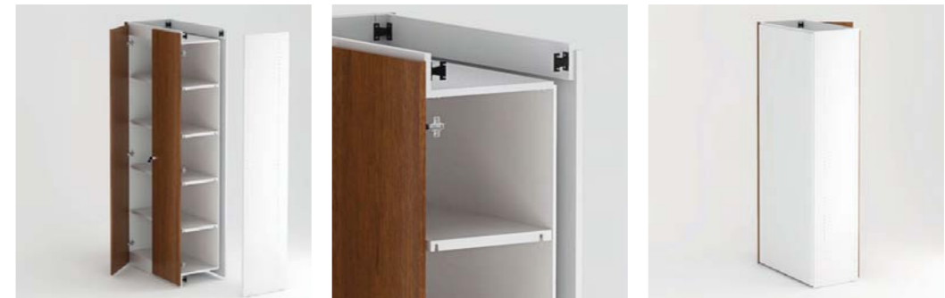
Armário de costa dupla com isolamento e estrutura standard Double back cabinet with isolation and standard structure