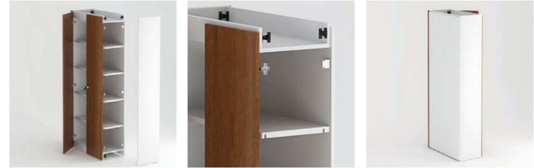
Armário de costa painel e estrutura standard. Back panel cabinet and standard structure.