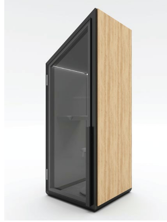
MÓDULO SIMPLES SIMPLE MODULE