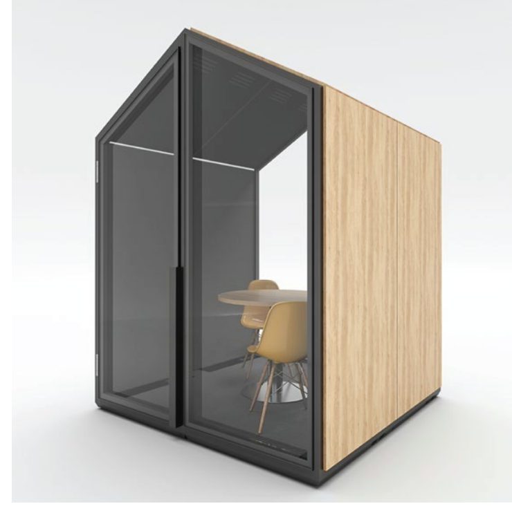
MÓDULO COMPOSTO (4) COMPOSITE MODULE (4)