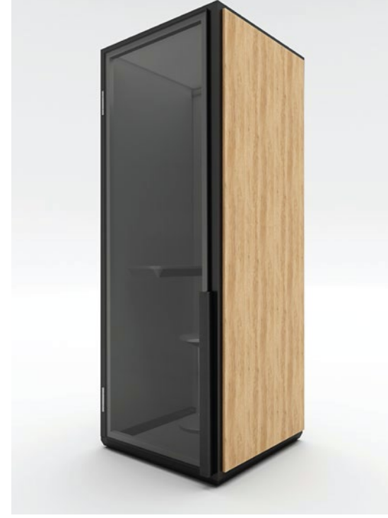
CUBE - MÓDULO SIMPLES CUBE - SIMPLE MODULE