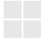
CUBE - MÓDULO COMPOSTO (4) CUBE - COMPOSITE MODULE (4)